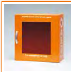
• Caja DEA (YZ-042H8)