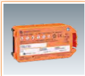
• Paquete de batería (SB-310V)