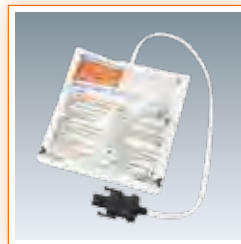
• Electrodos de desfibrilación (P-740K)

El presente folleto puede modificarse o reemplazarse por acción de Nihon Kohden en cualquier momento sin previo aviso.